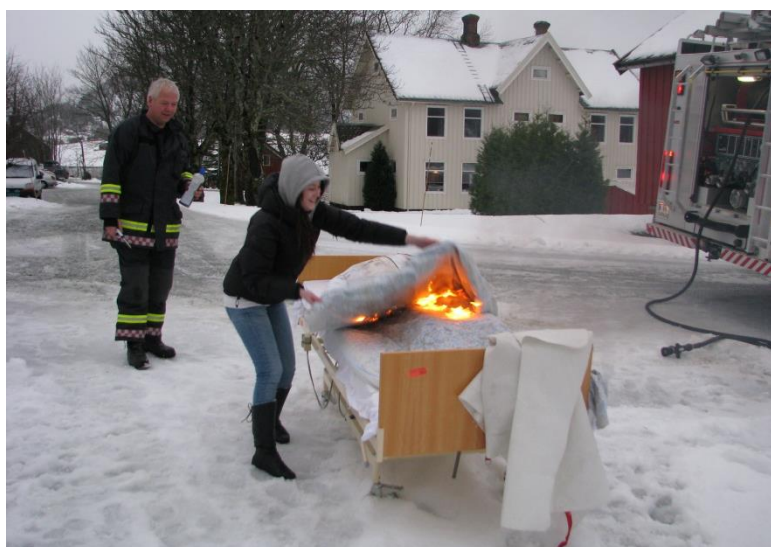
Sengebrann - Øvelse Agdenes helsesenter 2012