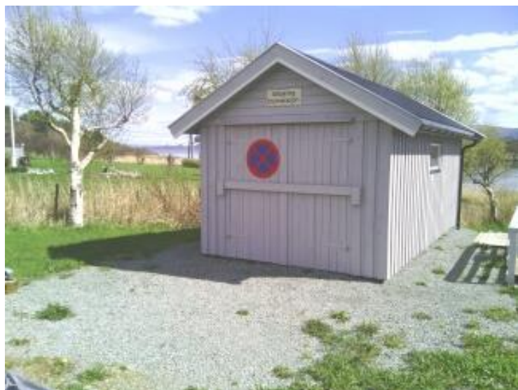
Leksa branngarasje mai 2015

Innbyggerne på Leksa etablerte i 2002 et frivillig brannvern, med økonomisk støtte fra Agdenes kommune og Gjensidige forsikring.