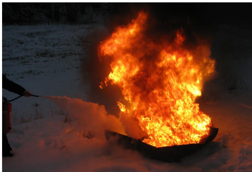
Øvelse 2012, bruk av håndslukker

Tankbil(ene) kjører ut samtidig med førsteutrykningen ved alle brannutrykninger i hele kommunen.