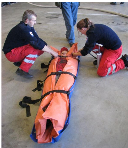
Agdenes Røde Kors. Åpen brannstasjon 2009